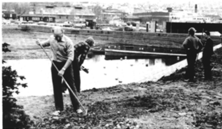
Dugnad i båthavna

Behovet for gode og trygge båtplasser har bestått i mange år her i byen. Det vanlige var å dra småbåtene på land når de ikke var i bruk, og dette var ikke noe stort problem med slike lette båter.