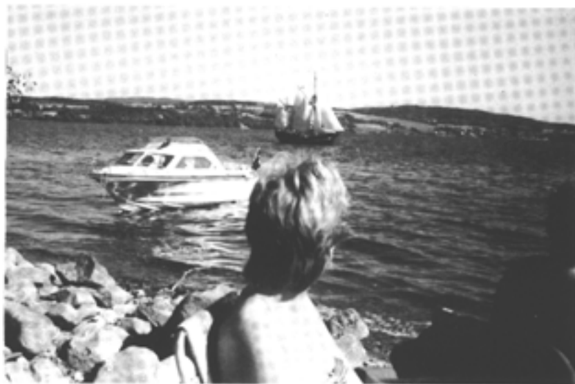
Sommeridyll ved Mjøsa

Et tilbakeblikk i GBFs beståen viser tydelig hvilket arbeid foreningens medlemmer har utført til beste for «båtfolket» i Gjøvik og omegn, til beste for byen og til almen glede ellers.