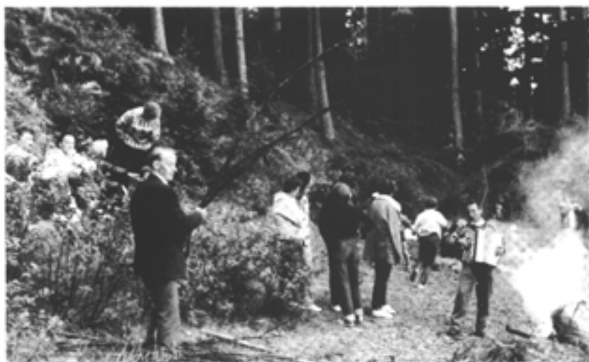
St. Hans-feiring på «Mjøsa»

hurtig, da den private og offentlige økonomi var i en heller dårlig stilling etter 5 lange krigsår.