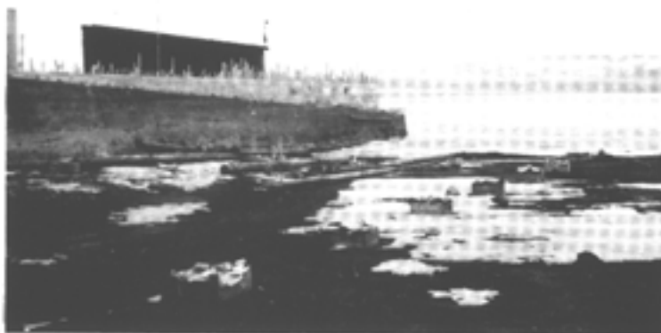
1966. Starten på småbåthavna i Gjøvik. Merk den lave vannstanden, dett er ved påsketider.