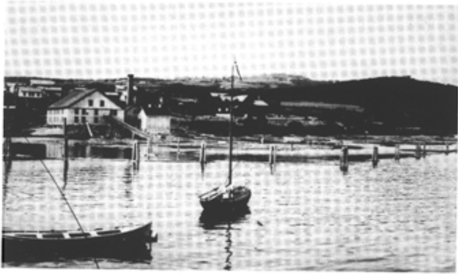
Gjøvik Båthavn 1890