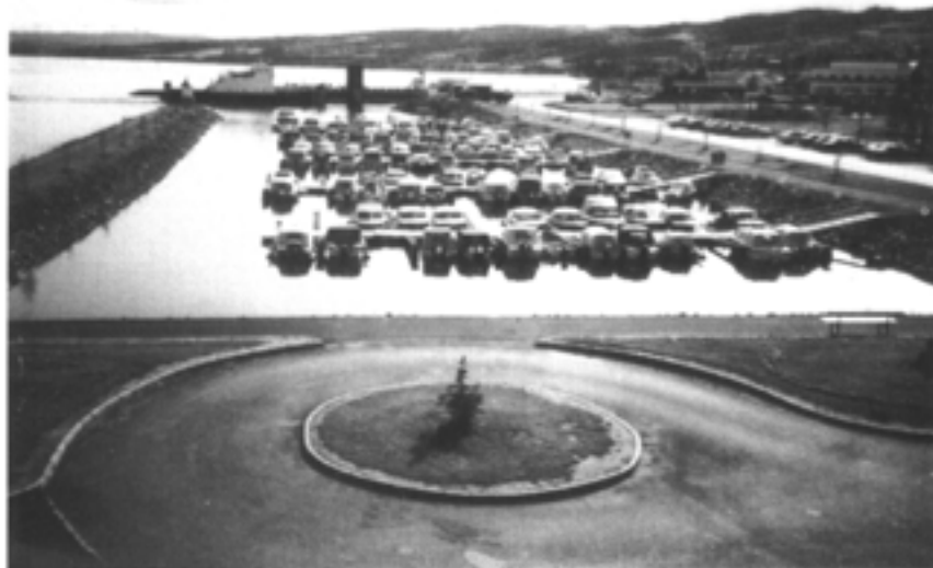
Nye båthavna 1996. Plass til 128 båtenr.