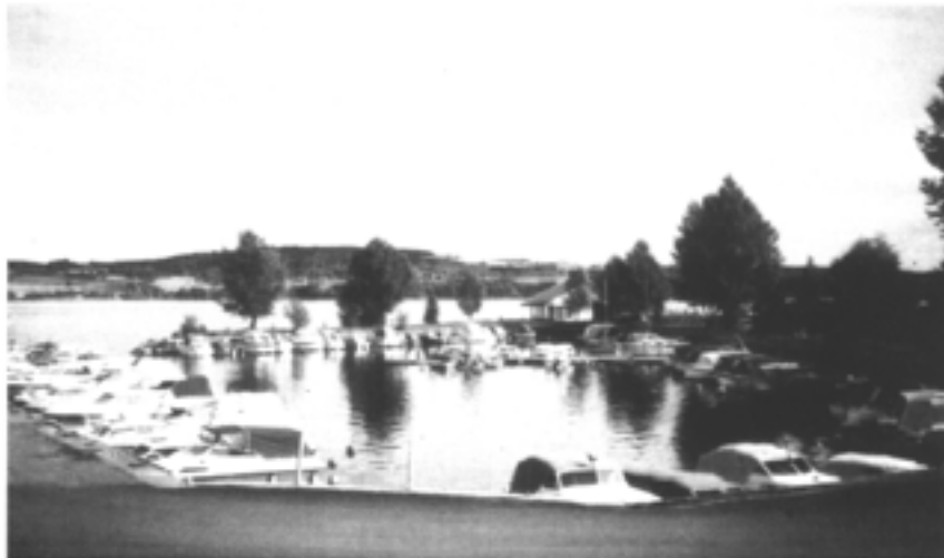
Gamle båthavna 1996

Det er ingen planer om utvidelse av havna i båtforeningens område. Vi vil i framtidig stand. Vi vil i framtiden legge vekt på å heve standarden