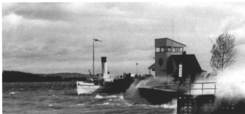
Den nye servicebrygga og klubbhuset

innvendig arbeid ble gjort på dugnad. Maling inn- og utvendig ble også gjort på dugnad. Totalkostnaden ble kr. 466.000,- Klubbhuset stod ferdig til innvielse 28 juni 1987. Varaordfører Wold stod for klipping av snora, så ble det fest for medlemmene.