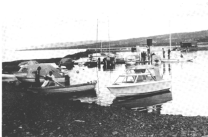
Fra byggingen av nyhavna