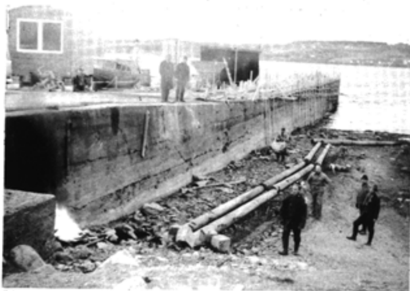
Båthavna i Gjøvik under anlegg 1967. Merk den lave vannstand

Foreningen satte da også trøstig i vei med anleggsarbeid. Etter avtale med grunneieren startet dugnadsarbeidet med traktorer og annen redskap i Fredvika, og alt så lyst ut. Men hvor lenge var Adam i Paradis. Kløke hoder i den kommunale administrasjon fant plutselig ut at nettopp her skulle den